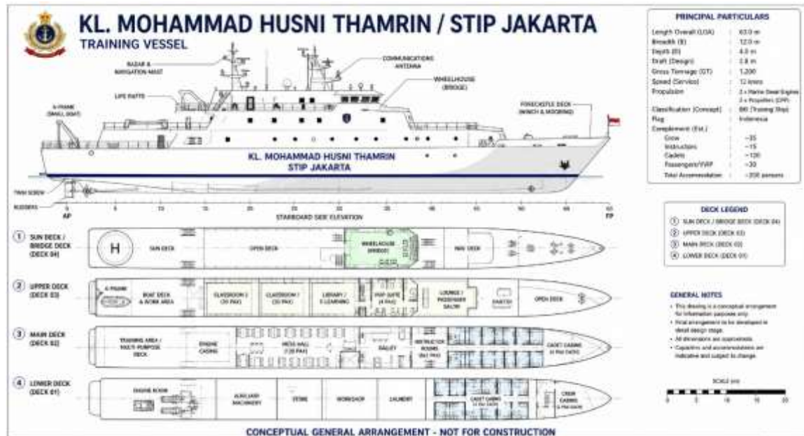
Gambar 1. General Arrangement KL. Mohammad Husni Thamrin

Data untuk penelitian ini dikumpulkan di atas kapal pelatihan Mohammad Husni Thamrin. Pengumpulan data untuk penelitian ini berlangsung selama dua bulan. Gambar 1 menunjukkan gambar teknis kapal pelatihan Mohammad Husni Thamrin: